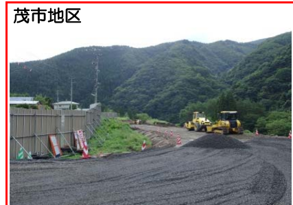
⑧施工：戸田・岩田地崎JV

仮橋の支柱立て込み状況 (仮)新箱石トンネルの工事を行うため仮橋を作っています。