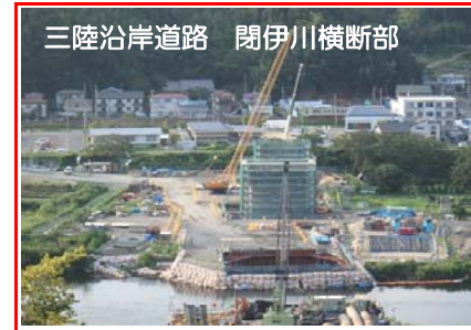
②施工：前田建設工業

松山千徳地区掘削状況 削った土の一部は近隣の市営工事、県営工事に利用されています。