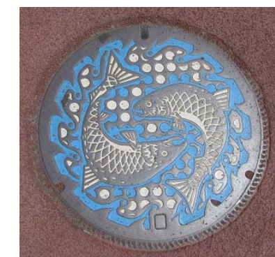
道の駅『みやこ』周辺で発見したマンホール蓋

ちなみに私は、宮古に来て初めて食べた『宮古産 鮭のみりん漬け』がお気に入りです。